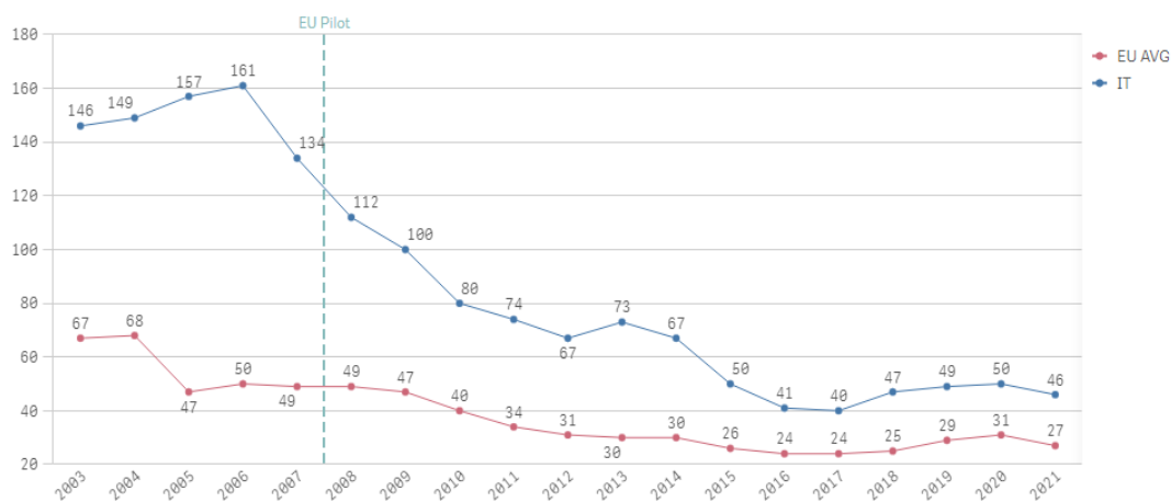
Evolution of infringement cases

Italia: Evoluzione dei casi di infrazione.