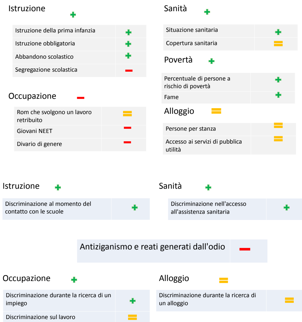
Grafico 2: evoluzione della situazione dei Rom nei vari settori strategici nel periodo 2011-2016: istruzione, occupazione, povertà, assistenza sanitaria e alloggi; discriminazione per settore e antiziganismo