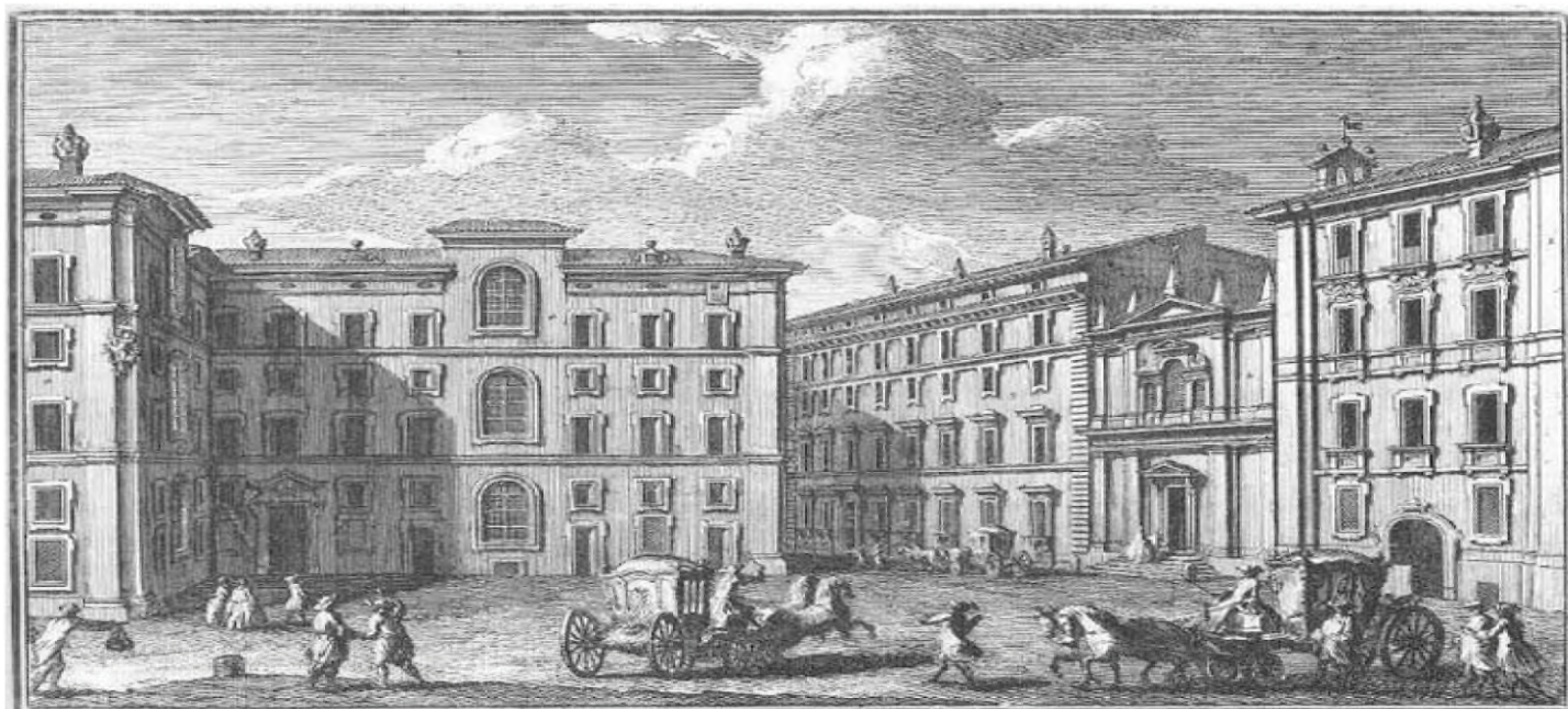
Seminario Romano 1. Caravaggio, che corrisponde sulla piazza di S. Ignazio, a Chiesa di S. Maria, e Prospetto del Seminario Romano a Parigi del Convento dei PP. Domenicani