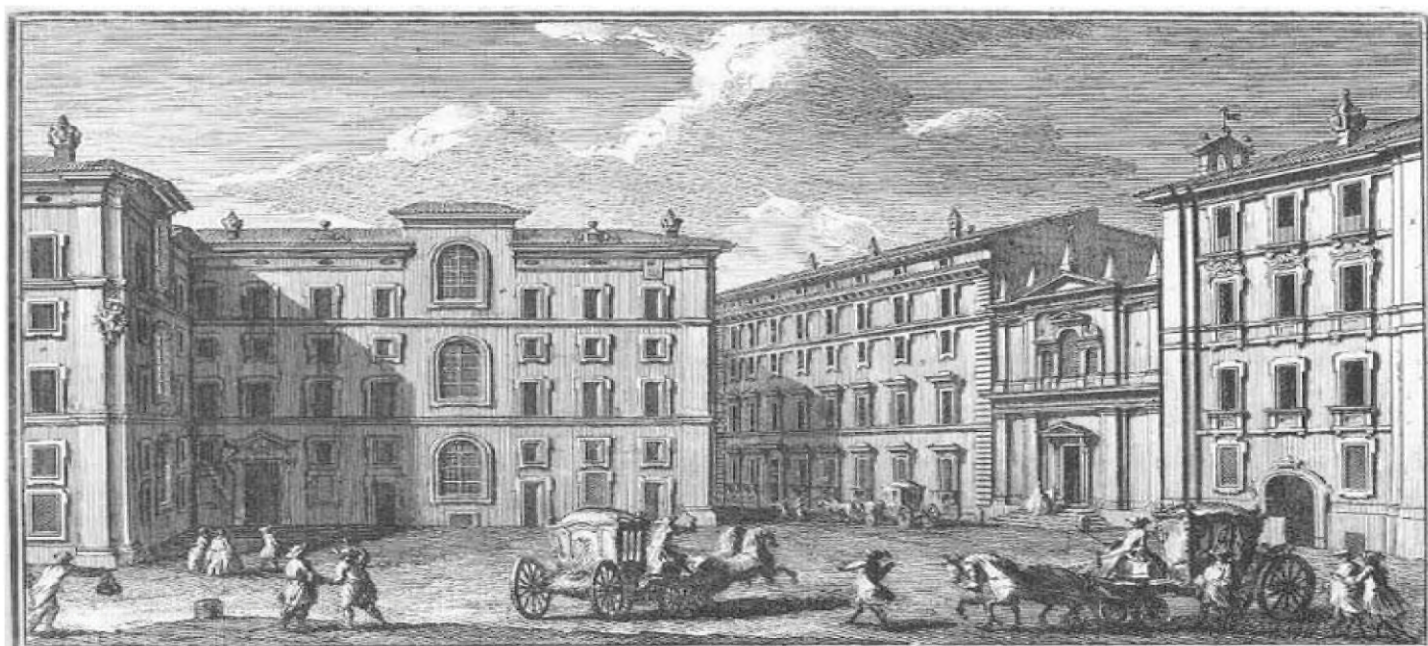
Seminario Romano 1. Caravaggio, che corrisponde sulla piazza di S. Ignazio, a Chiesa di S. Maria, 2. Prospetto del Seminario Romano a Parigi del Convento dei PP. Domenicani