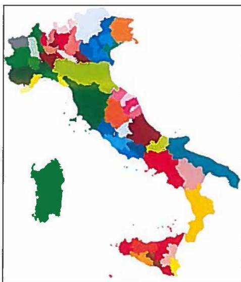
TAV. 1 – ATO unici regionali