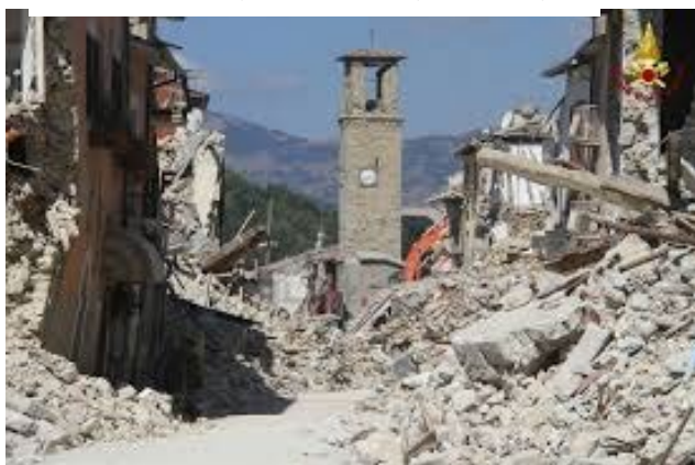
Campanile di Sant'Agostino – Amatrice

A seguito del positivo riscontro ottenuto nella gestione della ricostruzione degli eventi sismici del 2012, in virtù del know-how acquisito, Fintecna, con il Decreto-legge 1 ottobre 2016, n.189 convertito con modificazioni dalla Legge 15 dicembre 2016, n. 229, è stata chiamata a prestare la propria opera anche per gli eventi sismici che hanno interessato dal 24 agosto 2016 i territori delle Regioni Lazio, Umbria, Marche e Abruzzo, a sostegno degli Uffici del Commissario straordinario per la ricostruzione.