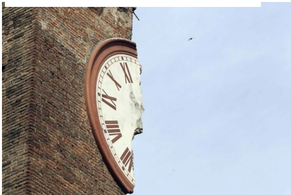
Torre dell’Orologio – Finale Emilia

Fintecna, in virtù del Decreto-legge 6 giugno 2012, n. 74 convertito in Legge 1 agosto 2012, n. 122, è indicata quale soggetto che assicura, sulla base di apposita convenzione da stipularsi con i Commissari delegati, il supporto necessario per le attività tecnico-ingegneristiche dirette a fronteggiare le esigenze delle popolazioni colpite dal sisma del maggio 2012 nelle Regioni Emilia-Romagna, Lombardia e Veneto.