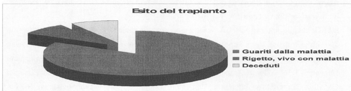
Immagine 2: esito degli interventi di trapianto di midollo osseo