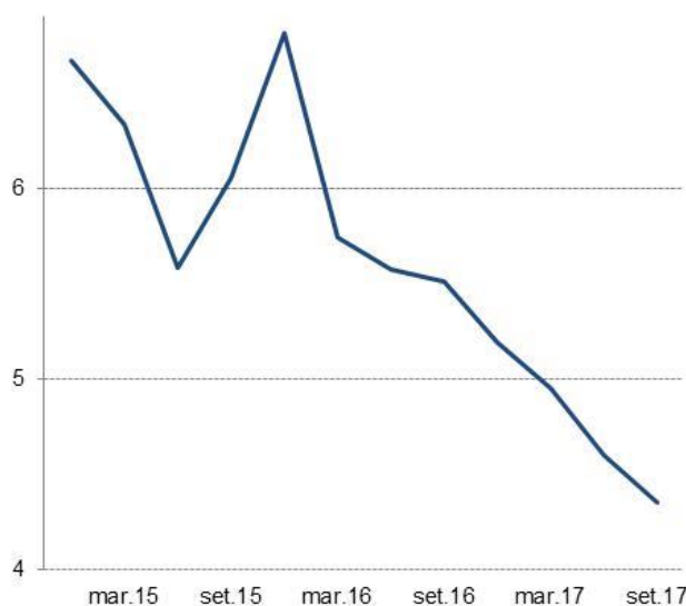
Figura 1: crediti deteriorati nell'UE Totale lordo dei crediti deteriorati e delle anticipazioni nell'UE, in % del totale lordo dei prestiti e delle anticipazioni, valori alla fine del trimestre

In particolare, i dati più recenti, relativi alla fine del terzo trimestre del 2017, confermano la tendenza al ribasso della quota di crediti deteriorati nell'UE, che è scesa di circa un punto percentuale (giungendo al 4,4%) su base annua (cfr. la figura 1) e dello 0,2% (pari a 40 miliardi di EUR) su base trimestrale, facendo così registrare il livello più basso dal quarto trimestre del 2014. Questo è il risultato di un calo dei volumi dei crediti deteriorati, nonché di un aumento dei volumi dei prestiti nell'UE. La quota di accantonamenti 15 è rimasta stabile, attestandosi al 50,7%. Malgrado tali sviluppi positivi si avverte l'esigenza di un'azione decisiva continuativa e accelerata.