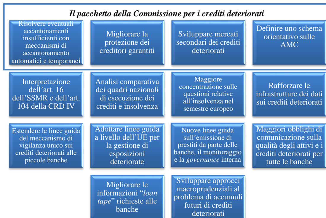
Figura 2: elementi del “Piano d’azione per affrontare la questione dei crediti deteriorati in Europa” del Consiglio 20