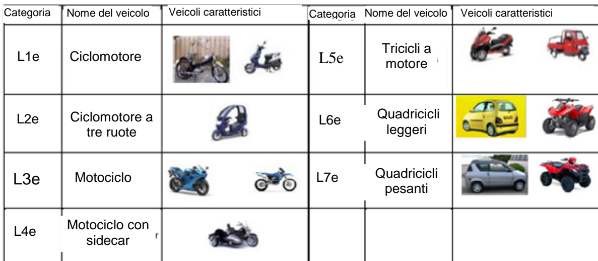
Figura 1: Esempi di veicoli oggetto dell'attuale direttiva quadro 2002/24/CE

Il termine "veicoli della categoria L" copre una vasta gamma di diversi tipi di veicoli con due, tre o quattro ruote, ad es. ciclomotori a due e tre ruote, motocicli a due e tre ruote e motocicli con sidecar. Alcuni veicoli a quattro ruote della categoria L, noti anche come quadricicli, sono quad da strada utilizzati su strade pubbliche e minicar.