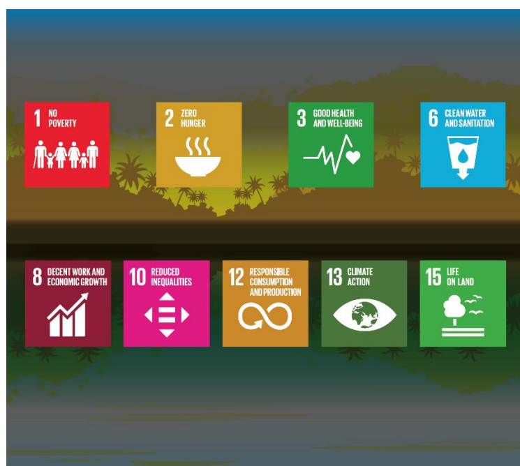
Figura 2 - Conseguenze della deforestazione sugli obiettivi di sviluppo sostenibile