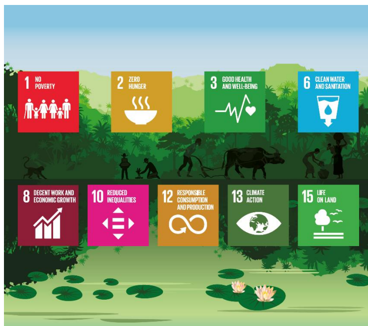
Figura 1 - Beni e servizi forestali che contribuiscono agli obiettivi di sviluppo sostenibile dell'ONU

Ulteriori misure dell'UE per la protezione delle foreste sarebbero coerenti con gli impegni e gli accordi internazionali, che riconoscono pienamente la necessità di interventi ambiziosi per invertire la tendenza alla deforestazione. L'accordo di Parigi sui cambiamenti climatici e il piano strategico per la biodiversità 2011-2020, adottati nell'ambito della Convenzione sulla diversità biologica delle Nazioni Unite e degli obiettivi di Aichi per la biodiversità, promuovono la gestione sostenibile delle foreste, la protezione e le attività di ripristino forestale 14 . Ridurre il degrado e la perdita di superficie forestale rientra tra le priorità del piano strategico delle Nazioni Unite per le foreste (UNSPF) 15 . L'intensificazione degli sforzi per la gestione sostenibile delle foreste è inoltre centrale nell'agenda 2030 per lo sviluppo sostenibile delle Nazioni Unite, in quanto le foreste svolgono una molteplicità di funzioni che contribuiscono al conseguimento della maggior parte degli obiettivi di sviluppo sostenibile.