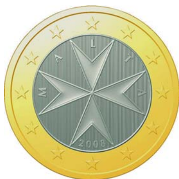
2 euro, 1 euro