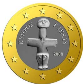
2 euro, 1 euro