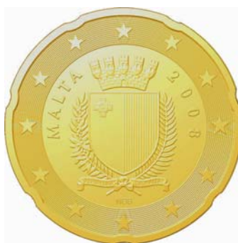
50 cent, 20 cent, 10 cent