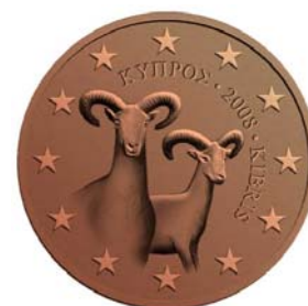
5 cent, 20 cent, 1 cent