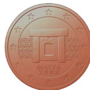
5 cent, 20 cent, 1 cent