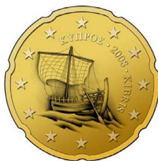
50 cent, 20 cent, 10 cent