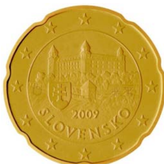
50 cent, 20 cent, 10 cent