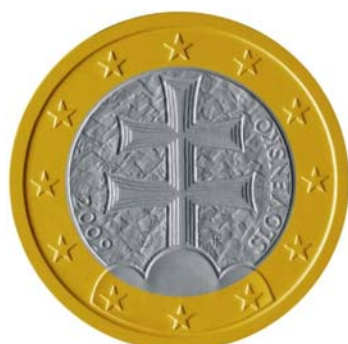
2 euro, 1 euro