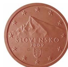
5 cent, 20 cent, 1 cent